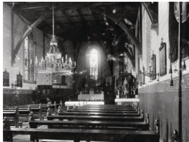
Innenraum der Kirche 1879