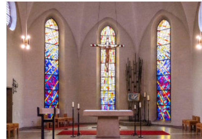
Herausgeber: Katholische Pfarrgemeinde „St. Elisabeth“ Weißenfels Fotos & Layout: R.-R. Hoffmann / Auflage: 500 Stück